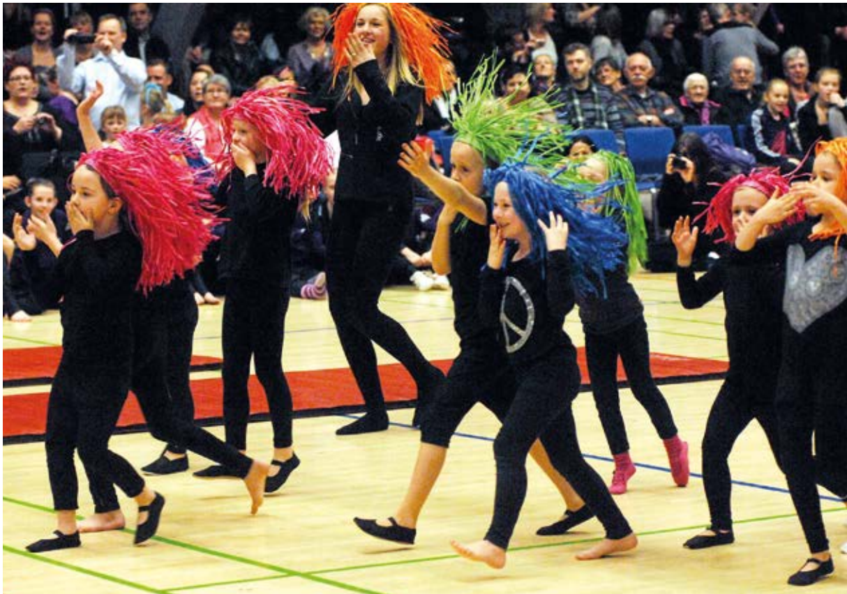
Indianerne var piger fra 5-6 år der deltog i gymnastikafdelingens forårsopvisning i 2012.