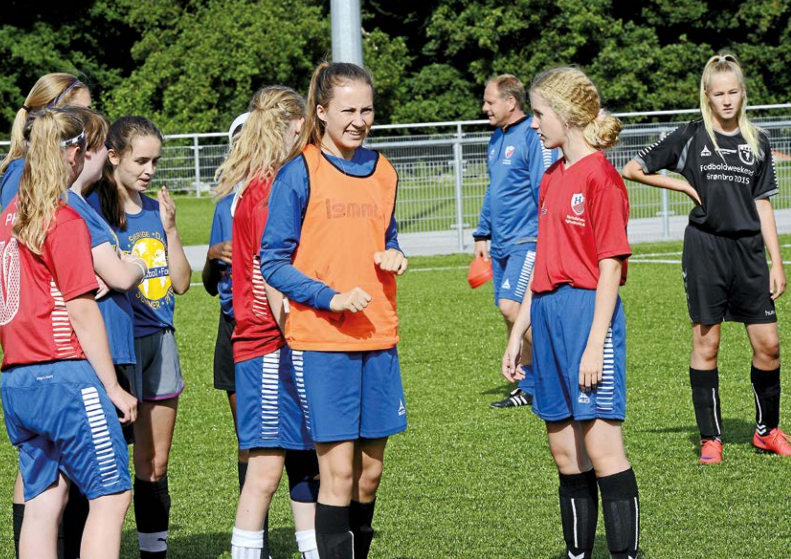
Pigefodbolden sprudler i HG med en Academy Camp.