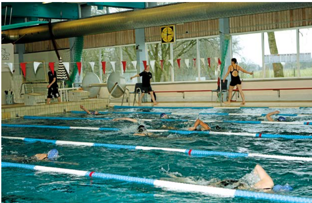
Sponsorsvøm i Herlufsholms svømmehal, som sandsynligvis erstattes af et nyt kommunalt svømmeanlæg i Næstved.