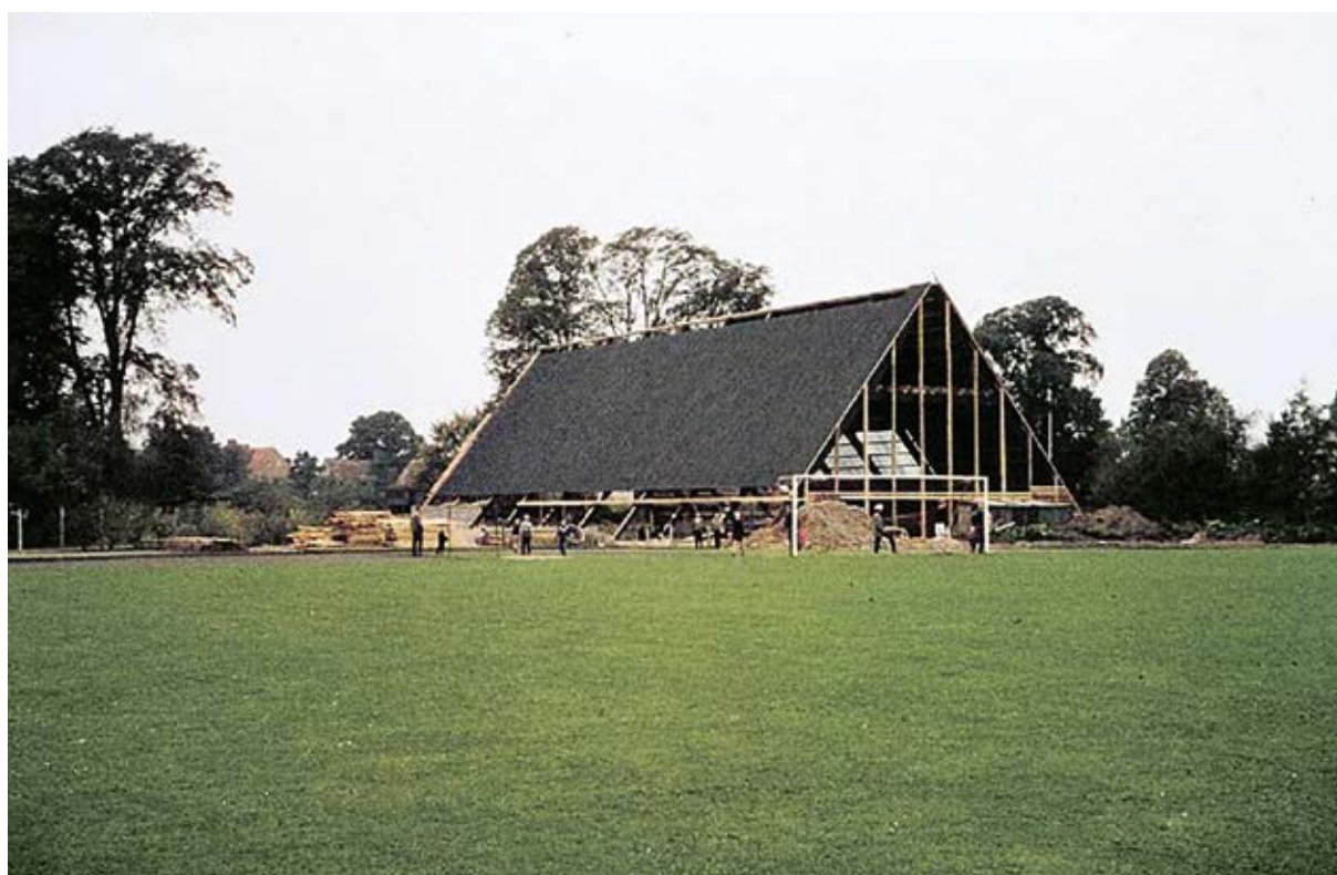
Herlufsholm Hallen opføres af frivillig arbejdskraft. Foto fra 1962.