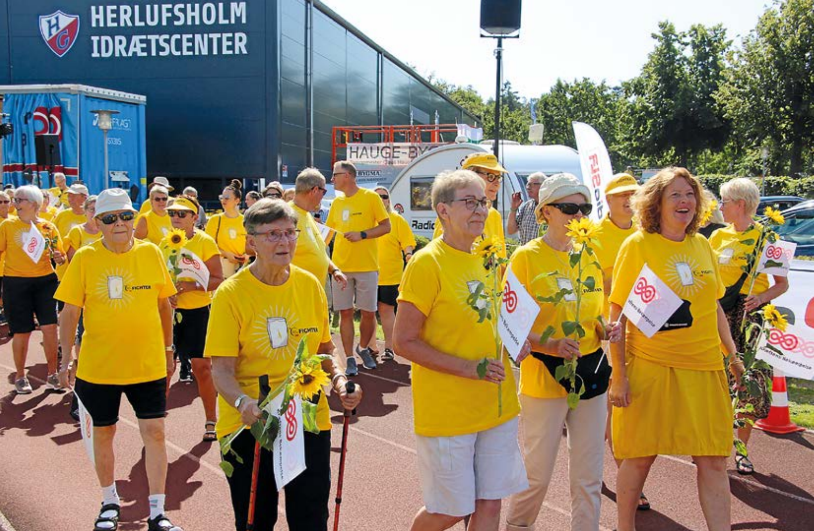
Stafet For Livet 2019 på Herlufsholm Stadion.